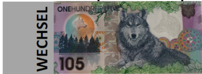
es gibt 2 Papier Wechsel: Immo-Wechsel und Bargeld-Wechsel