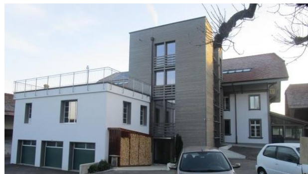
Restaurant OCHSEN in CH-3255 Rapperswil, Hauptstr. 42